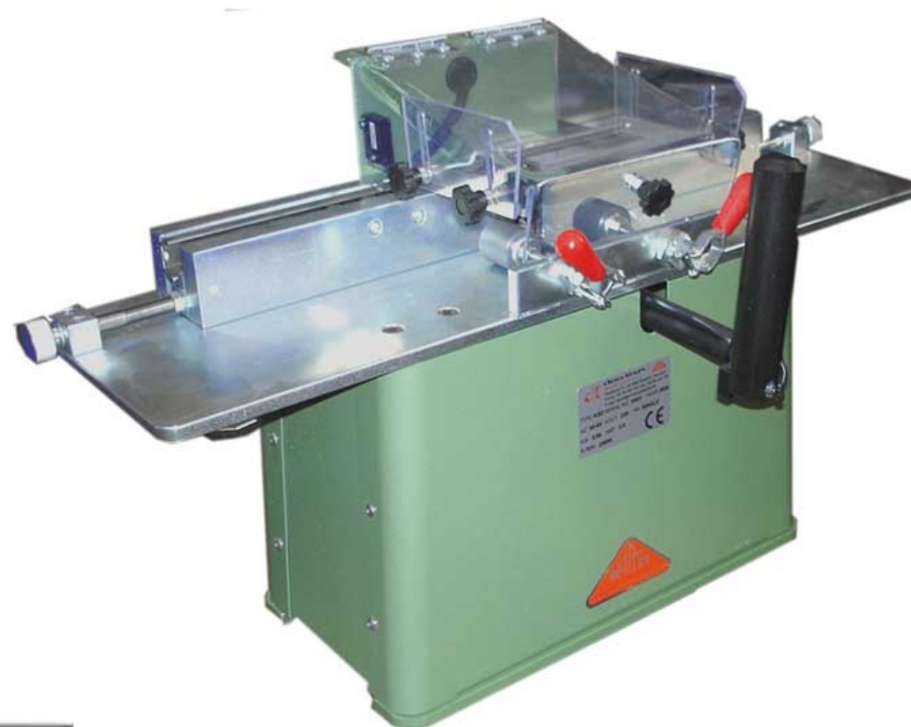
MORSØ Sprossefræser KSD