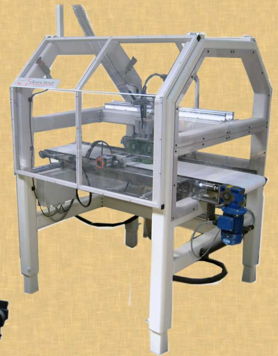
Fræser for blindnot i skuffesider.

Båndbane fra fræser til boremaskine to boring machine