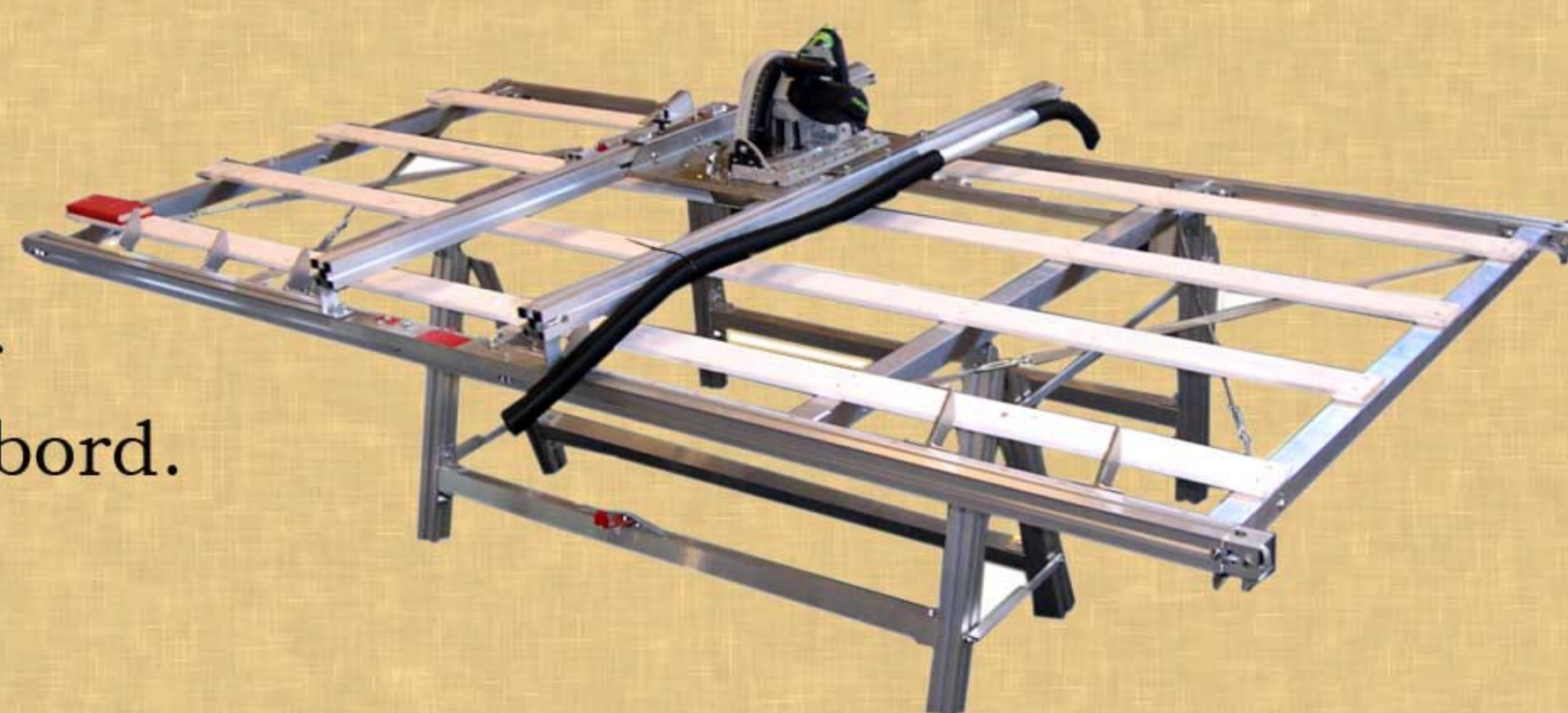
BMI Pladesaven i vandret position

Med BMI pladesavens kiplebare funktion er der gjort op med dårlige arbejdsstillinger, og da det er saven, man holder på og ikke emnet, er der praktisk talt ingen risiko for at komme i konflikt med savklingen.